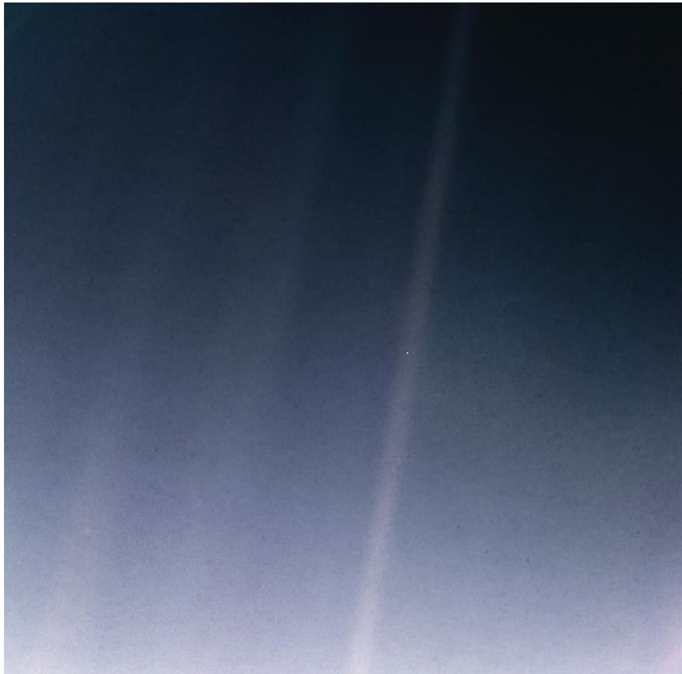
Země ze vzdálenosti 6 miliard km, jak ji vyfotografovala sonda Voyager 1 v roce 1990. Obrázek se stal známým jako Pale Blue Dot (Bleděmodrá tečka). Ze zhruba 600 000 px, které má původní fotografie, zabírá Země 0,12 px.

Na počátku, když Bůh tvořil nebe a zemi, byla země pustá a prázdná a nad propastí byla tma. A řekl Bůh: „Budiž světlo.“